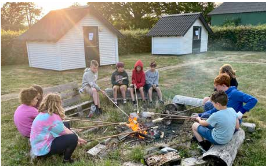
Bålhygge på jordbrugslejr

I år var sommerferien ekstra lang – og 7 uger kan være kedelig, hvis man ikke har planer, eller man ikke har nogen, at lave noget sammen med. Derfor havde vi åbent i flere sommerdage, end vi plejer, og vi spurgte børn og unge om, hvad de gerne ville, at vi lavede. De foreslog fx strandtur, fordi nogle børn aldrig havde været ved stranden. Derfor lejede vi en stor bus og kørte til Løverodde med børn, unge og frivillige på Jordbrugslejren. Inddragelse