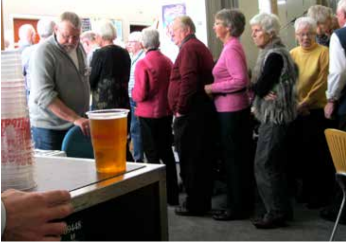
Før coronaen var "smørrebrødsfø- en" i pausen altid laang.

Mange forskellige frivillige har igennem årene ydet deres til, at det har kunnet lade sig gøre at få Kvarterhuset frem på "jazz-kortet".