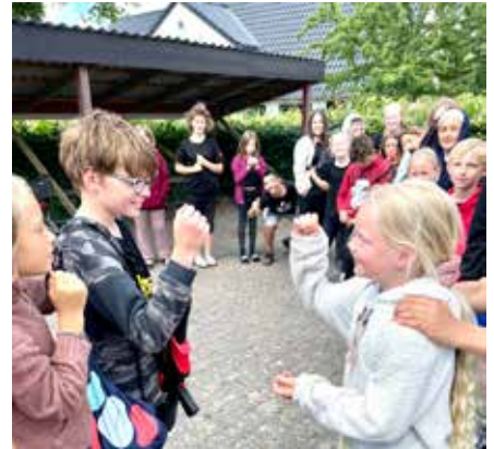
Forskellighed og fællesskab

ge i hytterne og kreative aktiviteter ved Perlemagi. Som nævnt havde vi en strandtur til Løverodde, og på trods af blæst hoppede mange børn og unge i vandet. Andre fangede krabber, spillede bold og gik på skovtur. Vi sluttede med at dele 30 pizzaer, som blev leveret af Yummi