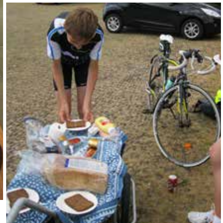
eller et "festmåltid" på cykelturen .....