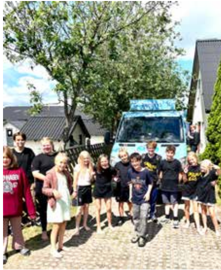
Hjem-is på bessøg

Hvis du vil være med til at arrangere SOMMERSJOV UGE 30 i 2024, så skriv til Uge 30's Venner