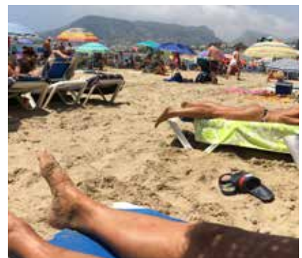
eller ligge på stranden...