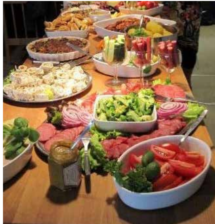
"Lidt" god mad .....