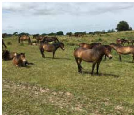
eller se på vilde heste på Langeland .....