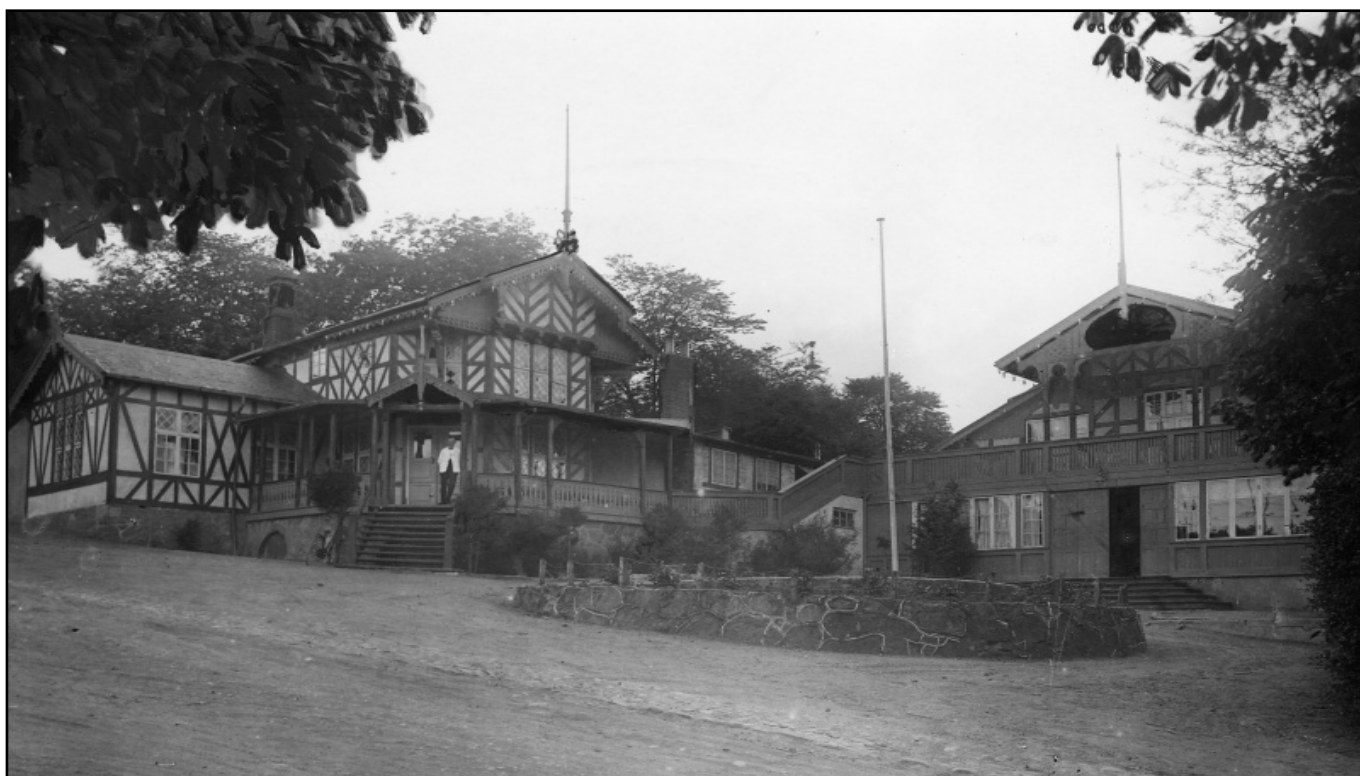
Alhambra ved Stejlbjerganlægget.

"Sommerlyst" var også arnestedet for de første sommerrevyer. Efter datidens forhold var det en begivenhed