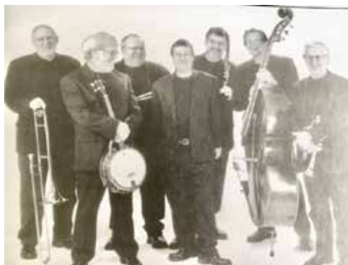
Bourbon Street Jazzband spillede til det første frokostjazz arrangement i Kvarterhuset-lørdag den 26. oktober 2002 kl. 13.00.

Dette kendskab til snart sagt alverdens jazzbands har igennem årene været en stor hjælp, når man ser på den mangfoldighed af orkestre, der har spillet i Kvarterhuset.