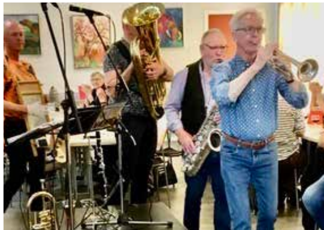
All Time Jazzband giver den "hele" armen.

I forbindelse med pandemien blev der ændret lidt ved afviklingen af frokostjazzen.