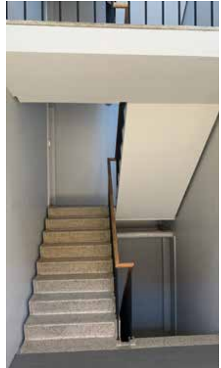
Opgang i de ny renoverede boligblokke