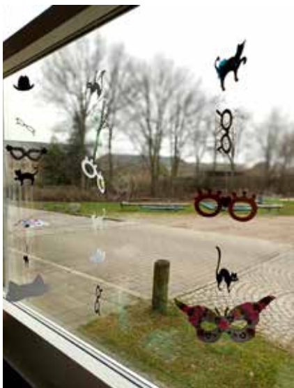
Der bliver pyntet op i Gademix og hver onsdag eftermiddag har vi åbent i det kreative værksted.

Kom ind i Gademix og hør, hvad der mere sker.