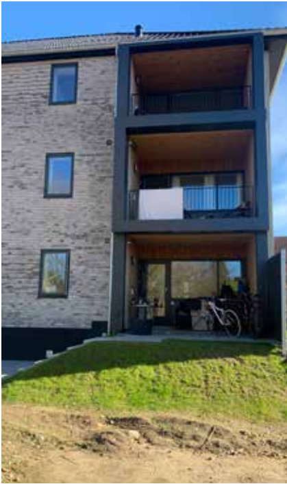
Dorthe's stuelejlighed med lille have