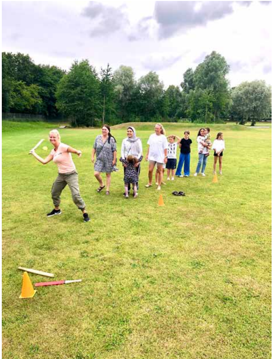
Billede fra Sommersjov uge 30 2022 – en uge med aktiviteter for hele familien.

Efter påske begynder vi et nyt samarbejde med Sus fra Byliv-Kolding. Børn mellem 10-13 år kan deltage i projektet, hvor de