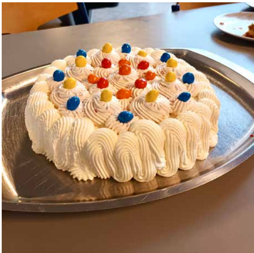
Hjemmelavet lagkage for at fejre fødselsdag for børn og frivillige i Gademix

DU kan finde os på INSTAGRAM og SNAPCHAT. Du kan skrive til os på facebook eller gademix@kfumsoc.dk