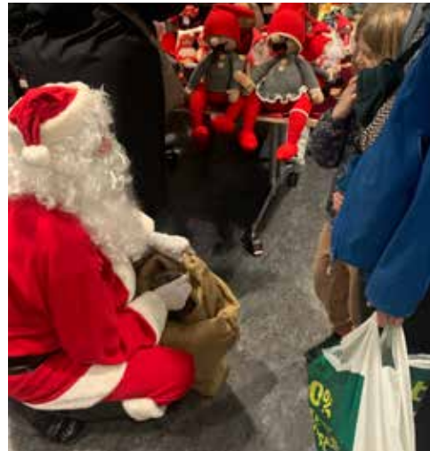
Julemanden havde små godteposer med i sin sæk til børnene, og fik sig nogle rigtig gode snakke - og mange gaveønsker. Mon ikke de fleste gaveønsker går i opfyldelse?