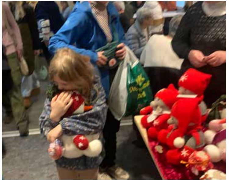
Åh - hvor kan man blive glad for en nisse