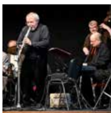
31/5 Kansas City Stompers