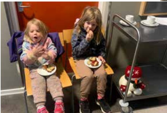
Mange ville have æbleskiver, så gangen blev midlertidigt spisested.