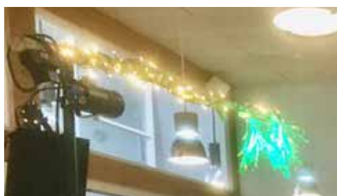
Karsten havde medbragt en mistelten, men ingen var så heldige at få kysset hinanden.