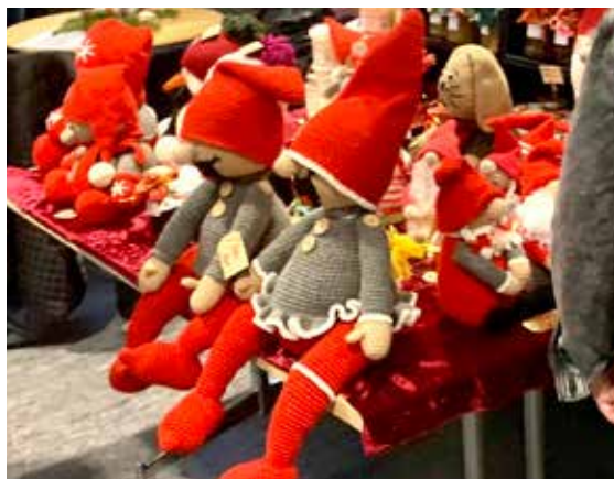
Nisser til salg

Mange børn i alle mulige fantastiske og uhyggelige udklædninger var rundt på gader og veje, og fik sig sunget til både slik og mere.