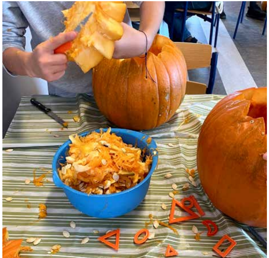
Der blev lavet lavet græskarhoveder

I efterårsferien havde Gademix åbent og arrangerede hyggelige aktiviteter for børn og unge. Første aften blev der tændt bål i kolonihaven, lavet snobrød og drukket en masse varm kakao med flødeskum. I ugens løb fik vi lavet græskarhoveder, spillet en masse