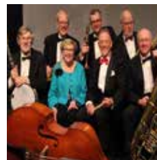
20/9 Peoria Jazzband