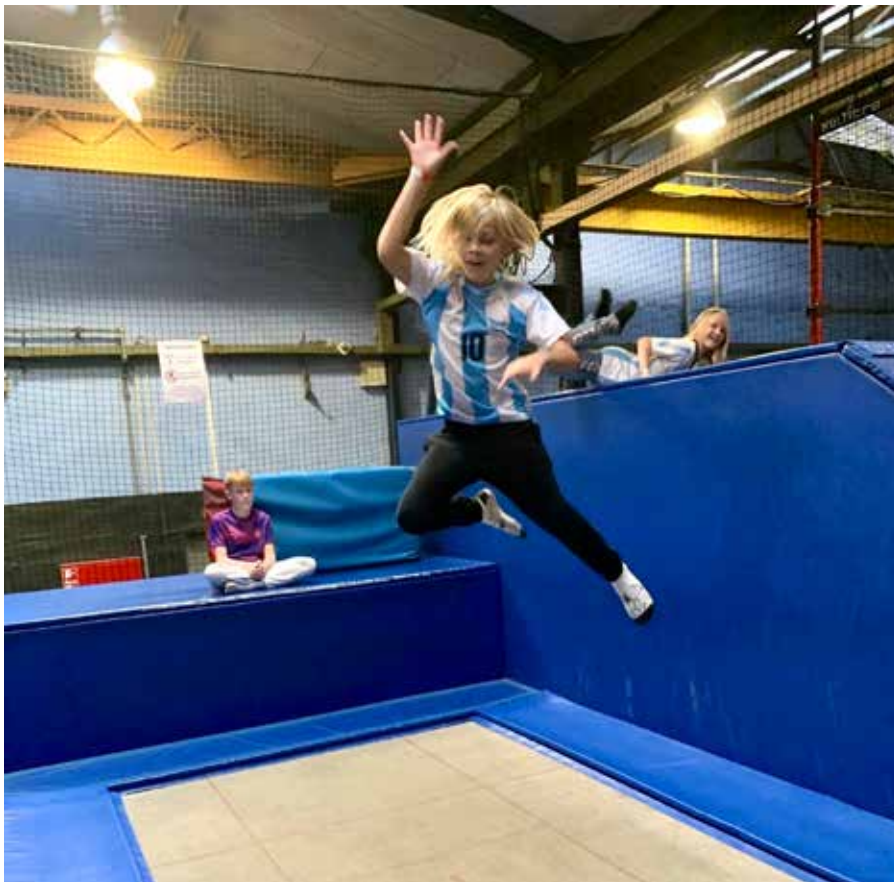
Børnene brugte masser af energi i løbet af dagen i BaboonyCity

en fællesoplevelse i stedet for lommepenge – og børnene er selv