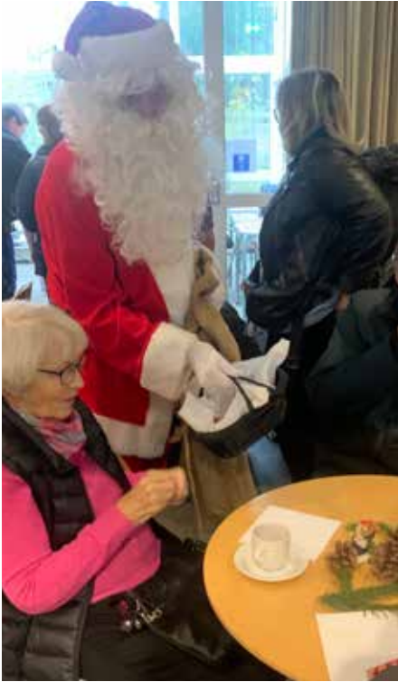
Julemanden havde også pebernødder til de lidt mere voksne

En dejlig dag med hygge og godt humør. Tak til alle.