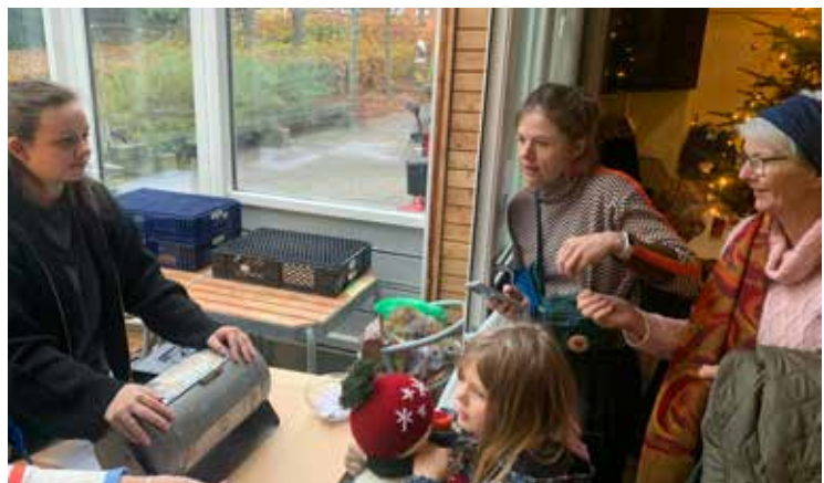
Kvarterhusets tombola fik også besøg, så gevinsterne blev revet væk.