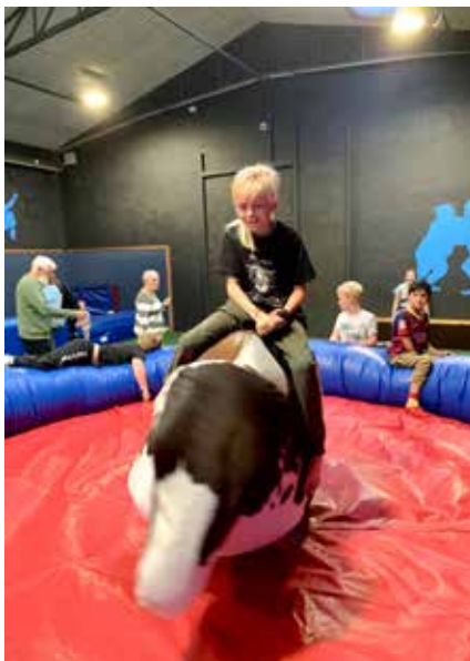
Sjovt i BaboonyCity

en fællesoplevelse i stedet for lommepenge – og børnene er selv