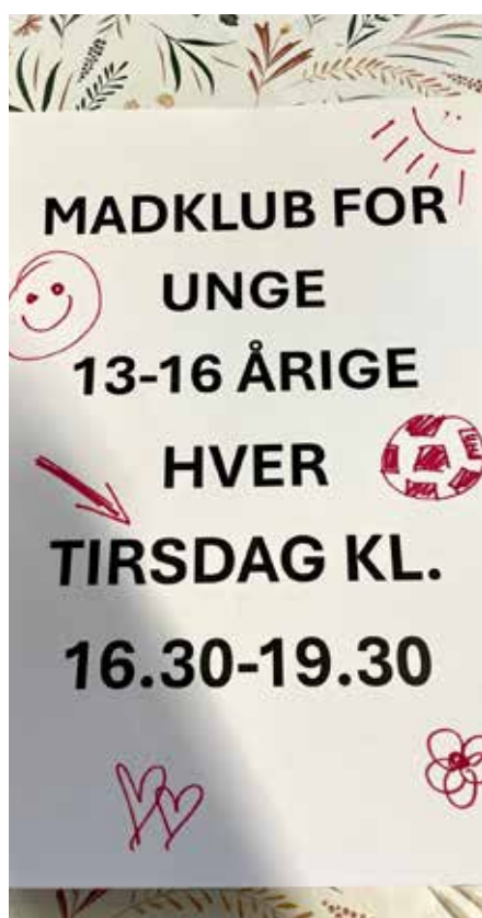
Madklub for unge mellem 13-16 årige

følgelig hjælper man hinanden med opvasken. (Bemærk vi har lukket i marts). TAK til LB-foreningen for jeres store opbakning til aktiviteter for unge.