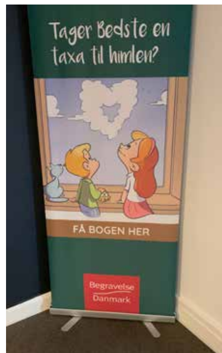
Reklamesøjle for børnebogen, som Begravelse Danmark har udgivet.