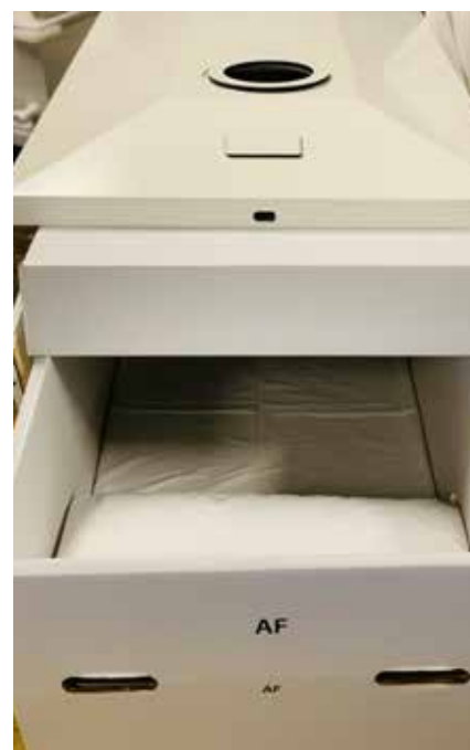
Her ses inderkisten af pap der ligger i en fin træ-kiste, som kan genbruges.