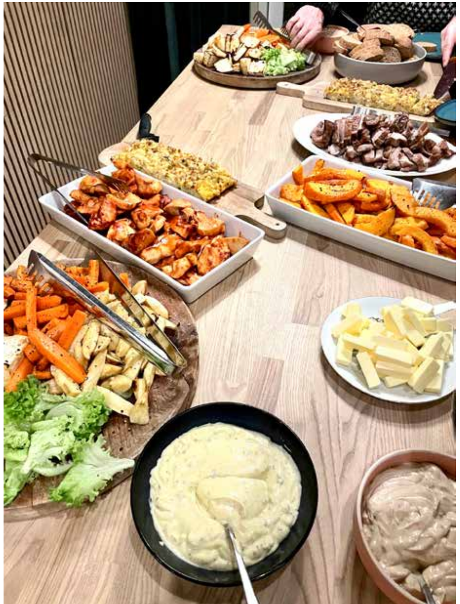
Vi hygger med blandt andet fællesspisning

Vi er rigtig glade for at vores nye samarbejde mellem Gademix, SSP og forældre til børn og unge i Sydvestkvarteret. Vi mødes hver 2-3.