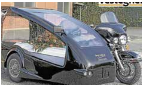
Motorcykel rustvogn en Harley Davidson som man kan bestille til sin sidste rejse.