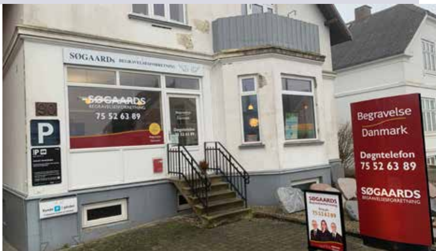
Søgaards Begravelsesforretning på Haderslevvej